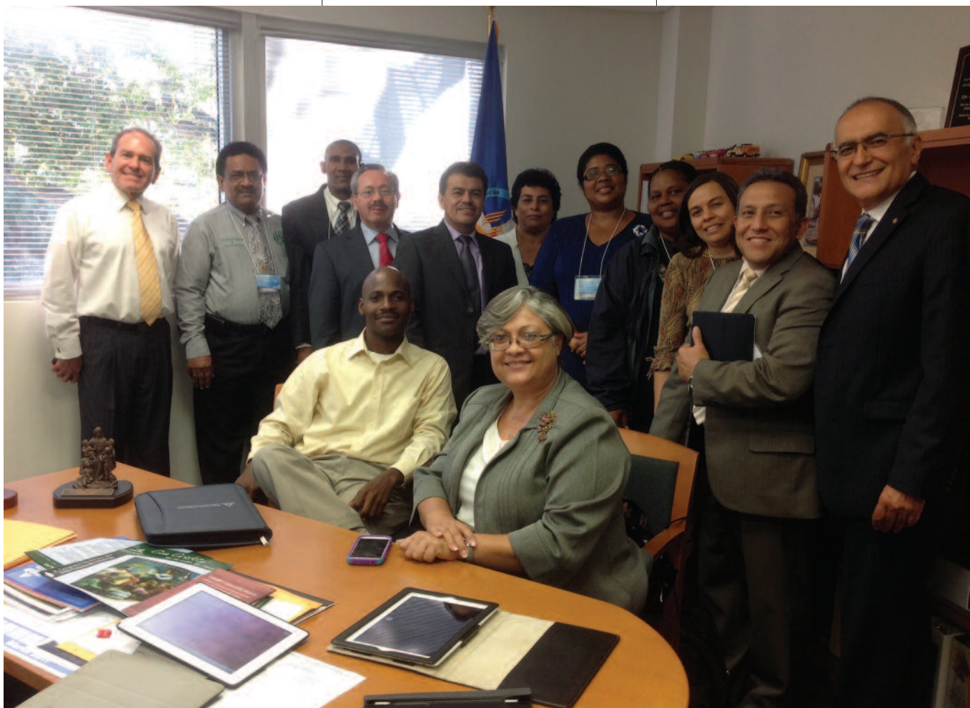
Les responsables de l'enseignement universitaire qui participèrent au Conseil sur l'instruction bilingue, parrainé par le département d'Éducation en 2013.

Le deuxième Congrès d'Éducation de la division, sous le thème « L'enseignant : un ministre de l'Évangile », a eu lieu en septembre 2014 et a réuni 1020 délégués – instituteurs du primaire et du secondaire, professeurs d'université, adminis-