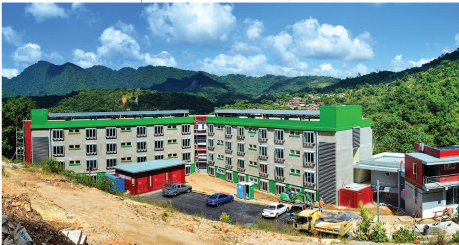
Construction du bâtiment Greaves qui accueillera les jeunes gens sur le campus de l'Université du Sud des Caraïbes (Trinité-et-Tobago).

Plusieurs universités ont vu la nécessité d'établir des campus satellites afin d'offrir une éducation adventiste aux étudiants qui ne peuvent pas se rendre au campus principal. Ainsi, six campus satellites ont ouvert leurs