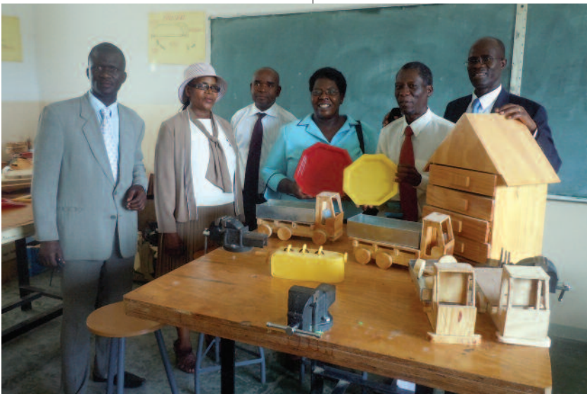
Platos plásticos y juguetes de madera hechos por alumnos del colegio Eastern Gate (Botsuana).

Cinco instituciones terciarias fueron evaluadas por la Asociación Adventista de Acreditación (AAA), con los resultados que se destacan a continuación: Se extendió el estatus de candidata a la Universidad Rusangu, de Zambia, mientras que las siguientes instituciones recibieron renovaciones a sus acreditaciones regulares hasta las fechas que se indican: La Universidad Solusi, en Zimbabue, hasta 2016; la Universidad Adventista Zurcher, en Madagascar, hasta 2016; y el Colegio Terciario Helderberg, en Sudáfrica, hasta 2018. La Universidad Adventista de Mozambique recibirá una visita de evaluación durante el próximo quinquenio.