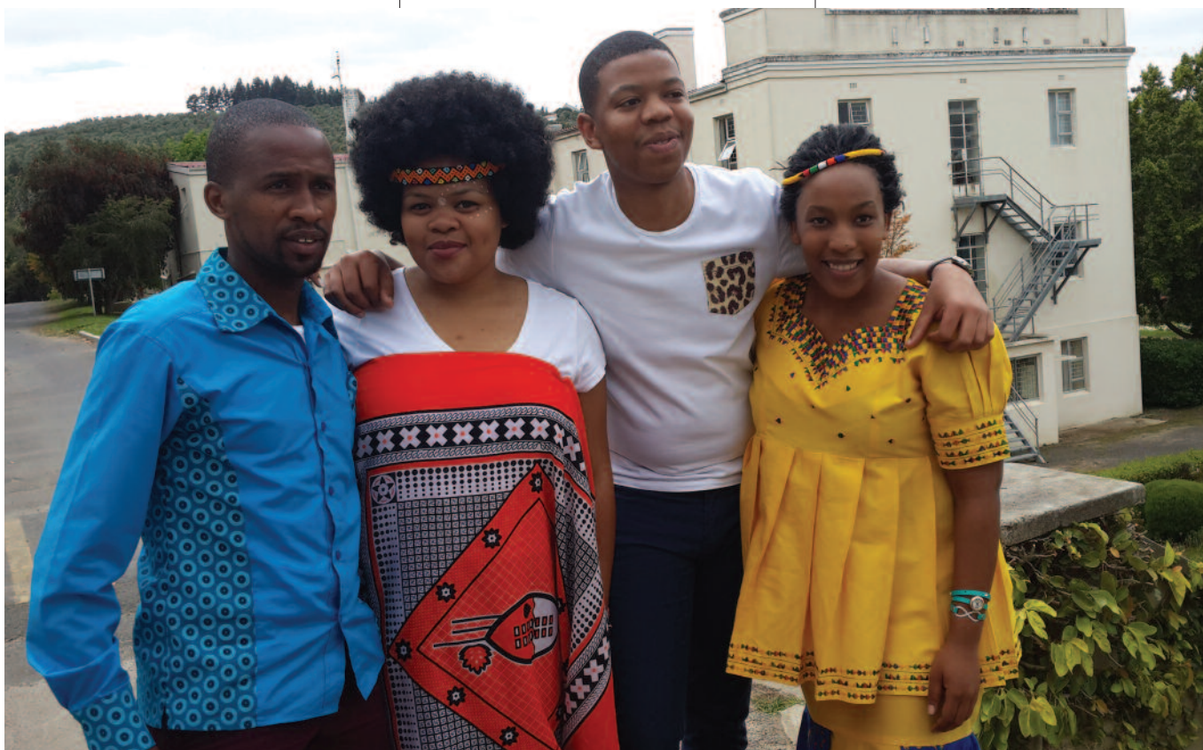
Celebración del “Día de la Herencia” en el Colegio Terciario de Helderberg (Sudáfrica).

• Día de la Herencia. El Colegio Terciario Helderberg celebra cada año su diversidad el 24 de septiembre: “Día de la Herencia”. La comunidad educativa y algunos invitados asisten a una colorida celebración en la que abunda la música, la poesía y los relatos que re-